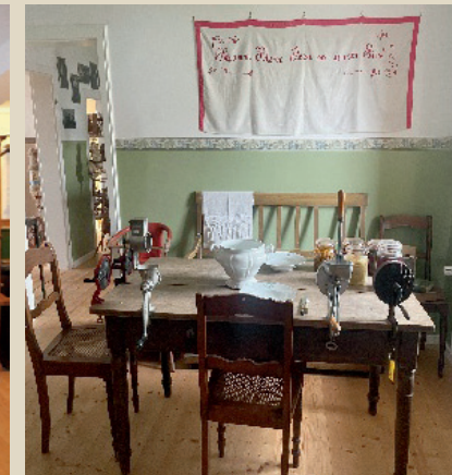
... und Küche