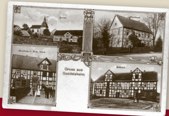
Sammlung historischer Ansichtskarten

Goddelsheim ist der größte Ortsteil der Stadt Lichtenfels und liegt zwischen Korbach und Frankenberg an der Grenze zu NRW.