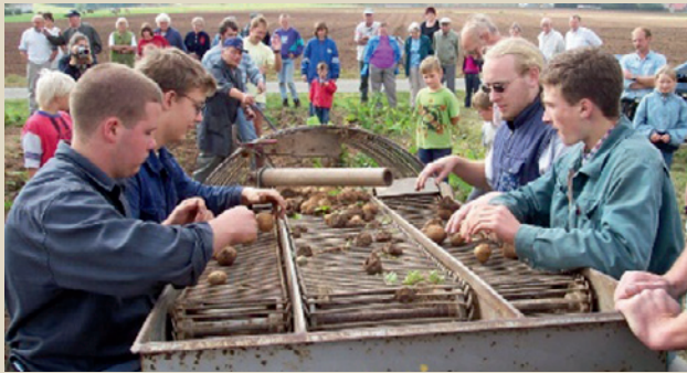
Kartoffelernte mit historischen Geräten